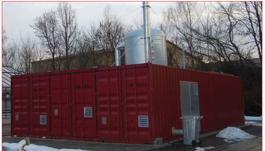
275 kW Komplett-Lösung schlüsselfertig